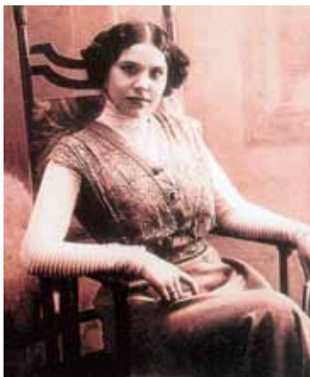
Надежда Плевицкая (1884-1940)

1957年生まれ。東京大学露文科卒業。編訳書『ロシア・アヴァンギャルド』1 未来派の実験、2 演劇の十月 (国書刊行会) 他。