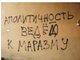
《Жить долго умереть молодым》