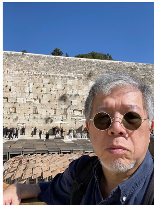
嘆きの壁と講演者

1957年東京生まれ。出版社、通信社勤務後、1994年から1999年までテレビ朝日モスクワ支局長。2016年から2021年までテレビ朝日アメリカ社長としてニューヨーク勤務。現在、ウェブサイト「テレ朝news」にウクライナ関連の記事を掲載中。著書『黒いロシア 白いロシア——アヴァンギャルドの記憶』、『マンハッタン極私的案内』、『絶望大国アメリカ——コロナ、トランプ、メディア戦争』(以上、水声社)