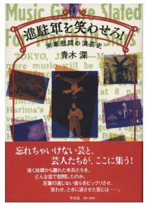
「進駐軍を笑わせろ!」——米軍慰問の演芸史 (平凡社/2022年10月刊)

1975年生まれ。都留文科大学比較文化学科教授。歴史人類学、ポピュラー音楽研究、日米交流史。 著書に『進駐軍を笑わせろ!——米軍慰問の演芸史』(平凡社)、『めぐりあうものたちの群像——戦後日本の米軍基地と音楽1945-1958』(大月書店、サントリー学芸賞受賞(社会・風俗部門))、『シリーズ戦争と社会 3 総力戦・帝国崩壊・占領』(共著、岩波書店)など。