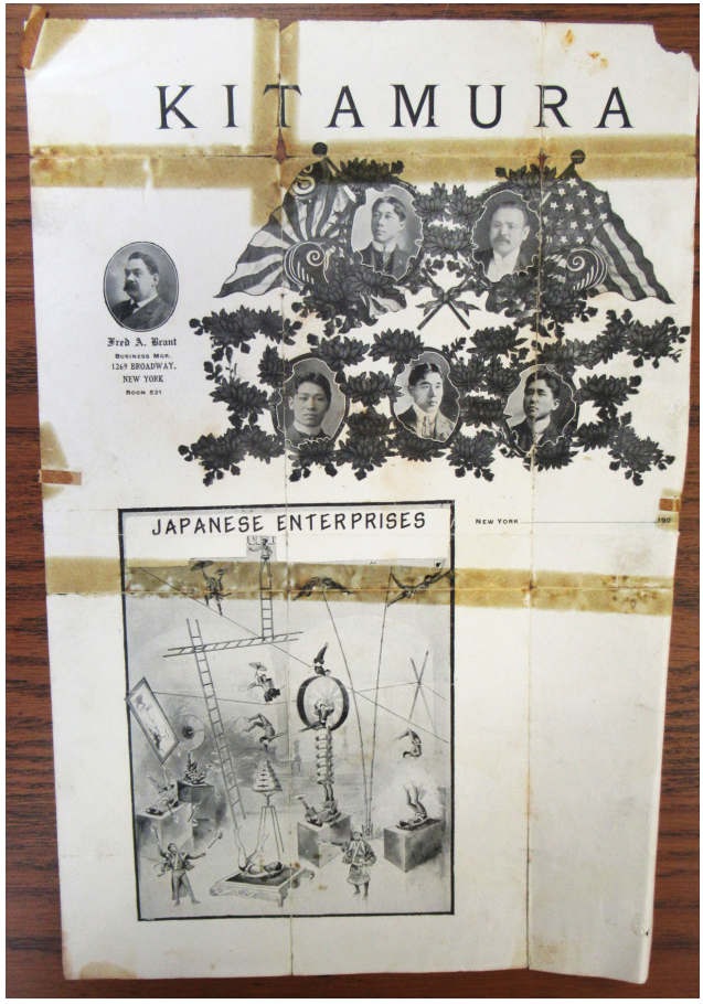
北村一座のチラシ(1900-10年代と思われる) ロバート・L・パーキンソン図書館/研究センター蔵、2019年8月21日撮影(青木深)

19世紀末から20世紀初めにかけて、アメリカ合衆国ではサーカスやボードビルが大衆娯楽としての「黄金時代」を謳歌し、地域・階級・世代・ジェンダー・人種・エスニシティの差異を横断して広く消費された。そこに定着していた演芸ジャンルの一つに「ジャパニーズ・アクロバット」があり、日露戦争をはさむ時期に最盛期を迎えた。安藤、上野、北村、杉本、難波、吹野、松本、山田ほか多くの一座が全米各地を回り、「日本人」のグループから離れてソロやデュオで演じた人びともいた。彼らや彼女たちはどのような演技をし、どのように評価されたのか。サーカスやボードビルの「黄金時代」が去り、映画をはじめとする複製技術が社会に浸透し、日米が「敵国」となるなかでどのように生きたのか。